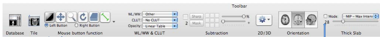
Bild fenstern von Hand