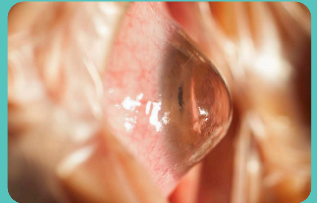
Hornhaut, die durch den Keratokonus verformt ist

Mit der Verkrümmung wird die Hornhaut zunehmend steiler, es kommt zu Sehkraftverlust und Hornhautvernarbung.