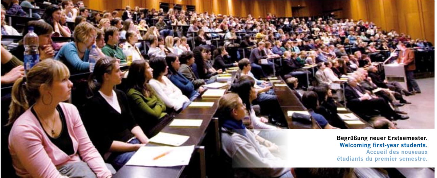
Begrüßung neuer Erstsemester. Welcoming first-year students. Accueil des nouveaux étudiants du premier semestre.

Seit zehn Jahren besteht am UKS ein Sonderforschungsbereich (SFB) zur Signalübertragung in Zellen und aktuell eine Beteiligung am neuen transregionalen SFB zur Fibrose, der krankhaften Vermehrung von Bindegewebe in Leber und Niere. Weiterhin gibt es zwei klinische Forschergruppen zu Hepatitis C beziehungsweise zu Umbauprozessen im Herzmuskel, die zu chronischer Herzinsuffizienz führen können. In drei Graduiertenkollegs werden exzellente Nachwuchsforscher ausgebildet.