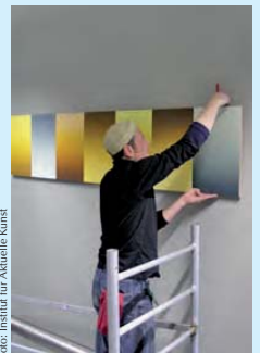
Aufbau der Arbeit von Alex Gern im Carreras-Zentrum

Das Institut für Aktuelle Kunst hat auf der Grundlage der vorhandenen Erhebungen, ergänzt durch aktuell hinzugekommene Kunstwerke eine kleine, handliche Broschüre entwickelt (Format 21 x 10,5 cm, 58 Seiten, 55 schwarz-weiß Abbildungen), anhand derer sich der Interessierte auf die Fährte nach der Erkundung der Kunst im Klinikum begeben kann. Die Fragen nach Kunst und Architektur, nach Kunst und Städtebau, nach Kunst und Gesundheit (Krankheit), nach Kunst und Wissenschaft werden hier neu aufgegriffen und an bestehenden Beispielen diskutiert.