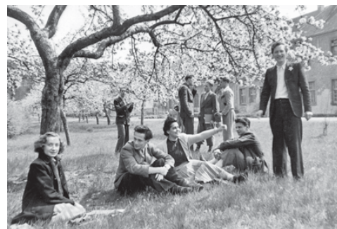
Campus im Grünen – Studentische Impressionen 1947/48

Im November 1947 wurde die Einrichtung in ein von Nancy administrativ unabhängiges „Höheres Studieninstitut in Homburg“ überführt, an dem im Februar 1948 auch mit philosophischen, juristischen und naturwissenschaftlichen Lehrveranstaltungen begonnen wurde.