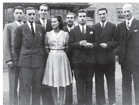
Die ersten in Homburg tätigen Dozenten und Mitarbeiter der Medizinischen Fakultät der Universität Nancy.

Damit wurde das Institut Sarrois d'Études Supérieures de l'Université de Nancy eröffnet, das damals unter der Leitung der Universität Nancy stand und auf dem Gelände der ehemaligen Pfälzischen Heil- und Pflgeanstalt in Homburg eingerichtet wurde.