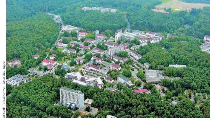
Aktuelle Luftaufnahme: Fotostudio Düppel

aus Speyer errichtet. Die einzigartige Anlage wurde als dezentrales Pavillonsystem im Jugendstil errichtet. Verwaltungs-, Wirtschafts- und Werkstättengebäude, Wohnhäuser des Personals, ein Festsaalgebäude, eine Kirche, ein Pförtnerhaus, ein Gutshof, eine Gärtnerei, sogar ein Kegelhaus mit Spielplatz vervollständigten die Anlage, die mit den notwendigen Versorgungseinrichtungen autonom konzipiert war. Die Gebäude