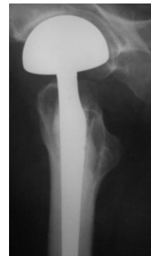
Abb.: Versorgung mit Hüftprothese (Duokopfprothese ohne Pfannenersatz)

werden. Bei verschobenen Schenkelhalsfrakturen ist das Risiko eines Absterbens des Hüftkopfes deutlich erhöht, da der Bruch auch die den Hüftkopf versorgenden Blutgefäße durchtrennt. In diesen Fällen wird direkt ein Hüftgelenksersatz mit Hüftgelenk-Endoprothese vorgenommen. Besteht schon vor dem Bruch eine Hüftgelenksarthrose (so gen. Coxarthrose), wird im gleichen Eingriff auch die Hüftpfanne ersetzt. In allen Fällen wird schon zum frühestmöglichen Zeitpunkt (ein bis zwei Tage postoperativ) mit Gehübungen begonnen.