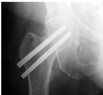
Abb.: Versorgung mit Spezialschrauben (minimalinvasive Technik)

Die Therapie ist heutzutage nahezu ausschließlich operativ, da nur damit eine sofortige Mobilisation zur Vermeidung von Schäden aufgrund von längerer Bettlägerigkeit wie Lungenentzündungen, Thrombosen und Embolien und Druckstellen erreicht werden kann. Bei eingestauchten und wenig verschobenen Schenkelhalsfrakturen wird eine Verschraubung in minimalinvasiver Technik vorgenommen. Dabei entsteht praktisch kein Blutverlust und schon am Tage nach der Operation kann unter physiotherapeutischer Anleitung mit Gehübungen begonnen